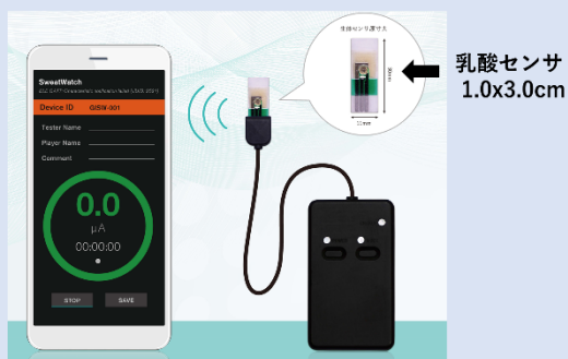
汗中乳酸測定ウェアラブル機器